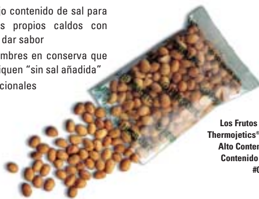
Los Frutos Secos de Soja Tostados Thermojetics® para una Nutrición con Alto Contenido en Proteínas y Bajo Contenido en Hidratos de Carbono #0048 (14 bolsas por caja)

Hay pequeñas cantidades de minerales en la sal del mar que no contiene la sal normal. Aunque éstos podrían resultar beneficiosos, es importante que tus clientes reduzcan su consumo de sal de mar.