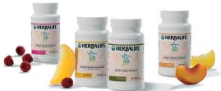
Imagen representativa – los productos de esta página pueden variar dependiendo del país.

¡No podría ser más sencillo ni más divertido, tomar un tentempié saludable!